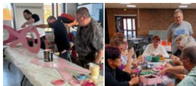
Réalisation de rubans blancs et de bijoux par les personnes suivies par le CCAS dans le cadre de l'action Les Ateliers Mâlins.

Pour contribuer à cette cause, rendez-vous le samedi 19 octobre sur la place du Dr Urbaniak dès 16H. Au programme : marche colorée, défilé, vente de bijoux réalisés par les Ateliers mâlins, puis spectacle à l'espace culturel.