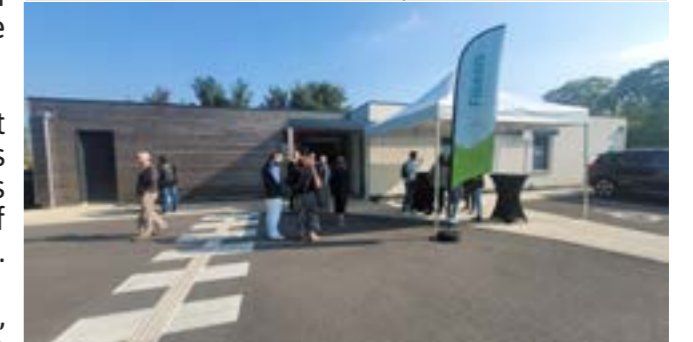
Découpe du ruban tricolore en présence du Sénateur M. Darras.