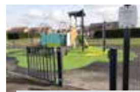
Aire place de la Marne.