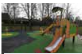
Aire rue Florent-Evrard.

Le projet des aires de jeux, amorcé en 2019, vise à offrir des activités dans chaque quartier pour tous les âges. Ces prochains mois et années, la Ville développera ces aires de vie pour, cette fois, divertir les 11-17 ans et plus.