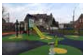
Aire rue De Lassigny