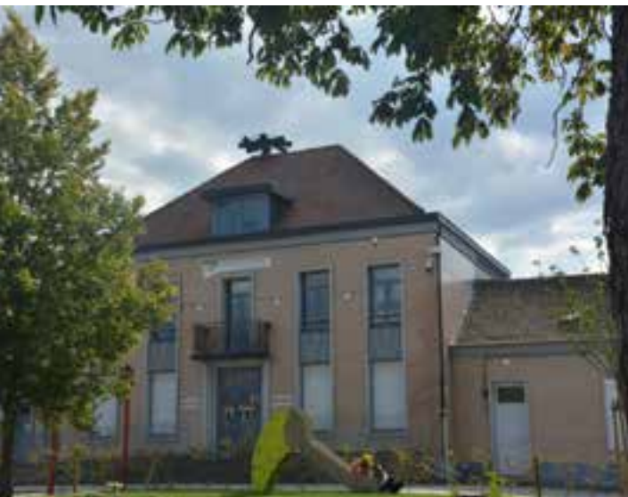
La Maison de la solidarité est aux normes d'accessibilité PMR (personnes à mobilité réduite).

Les services sociaux (CCAS, emploi-insertion, logement, accueil enfants-parents...) disposent d'un lieu qui leur est dédié pour répondre efficacement aux besoins