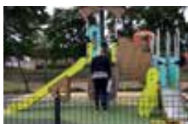
Aire au foyer Gonthier.