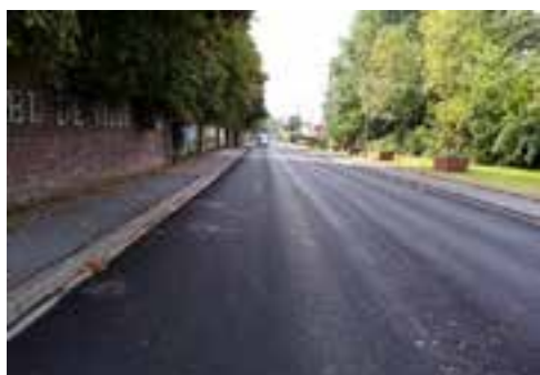
Nouveau revêtement de la rue Dutouquet, avant pose de la nouvelle signalétique.