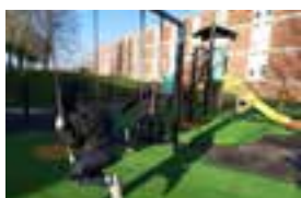
Aire boulevard Basly.