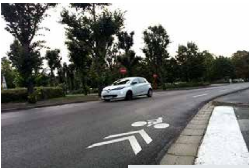
Rue Dutouquet, chaucidou aménagée.