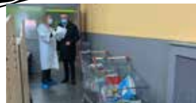
Drive pour les bénéficiaires du Trait d'Union lors du confinement.