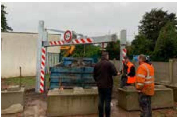
Installation de portiques aux stades contre l'intrusion illégale des gens du voyage.