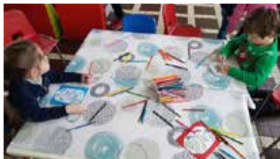
Depuis le lancement en septembre, les centres de loisirs du mercredi se déroulent à l'école Jaurès.

Foyer Gonthier, rue Descartes Infos sur la garderie et les centres de loisirs des mercredis au 03 21 72 78 00. Inscriptions sur MY PERI'SCHOOL.