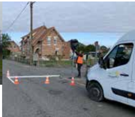
Mise en place de panneaux «stop», chemin des Soldats et autour de l'école Kergomard.