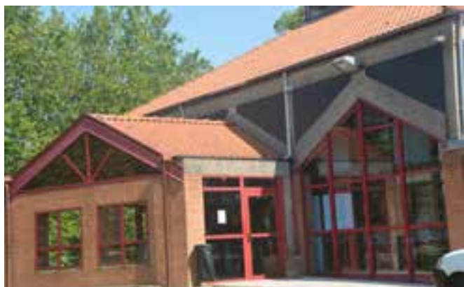
Le Foyer Gonthier est situé au pied de la Maison des 3 cités, et de l'école Pasteur.

La garderie des 3 Cités et le centre de loisirs des mercredis seront transférés, dès janvier, au foyer Gonthier dont la configuration est plus adaptée à l'accueil des enfants