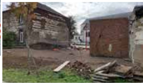
Démolition du bâtiment entre le PMU et le comité historique, rue Lefebvre.