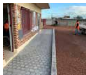
Réfection des WC cimetière cité 7, avec réalisation d'une rampe d'accès PMR.