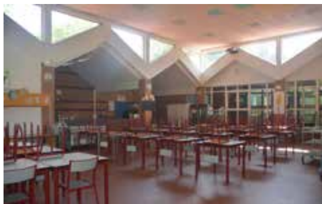
Le foyer dispose d'un grand réfectoire avec self-service et de pièces où mangent les maternelles.

foyer dispose d'un espace vert et que la cour de l'école Pasteur est située en face ;